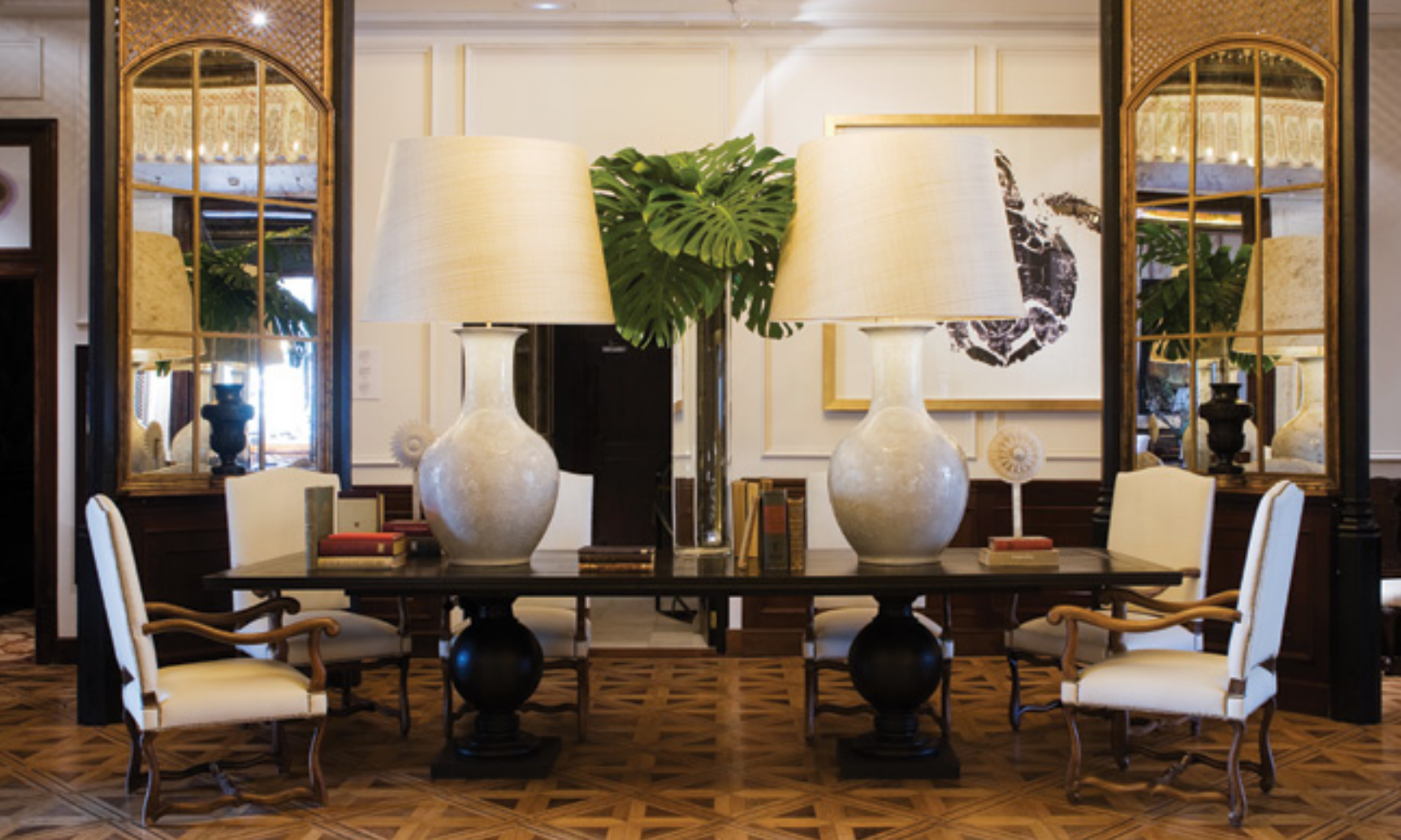
Detalles del interior reformado / Details of the renovated interior