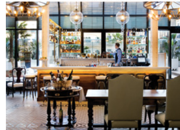
Batuar Cocktail Bar & Restaurant / Batuar Cocktail Bar & Restaurant

Flor de algodón, o lo que es lo mismo "gossypium", es el oráculo de la información donde cualquier duda o curiosidad será satisfecha y conocer así Barcelona y sus secretos. Dormir entre algodones es posible en Cotton House. Una sensación ligera y revitalizante que ya formará parte de su bienestar personal.