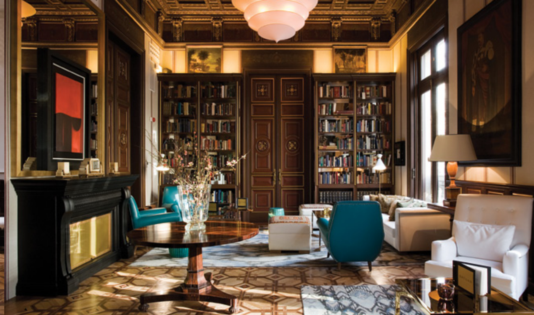
Detalles del interior reformado / Details of the renovated interior